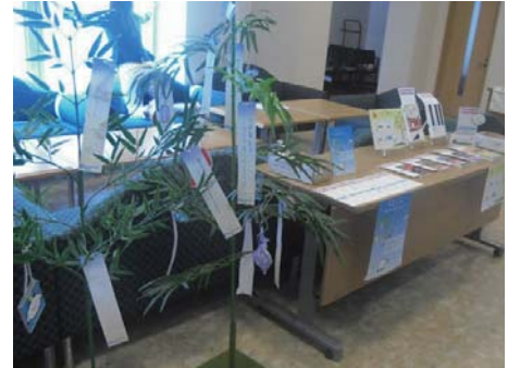
好評だったブック交換コーナー。読み終わった本を置いて、誰かが持ってきた本と交換できます。自由に願い事を書ける七夕コーナーも。