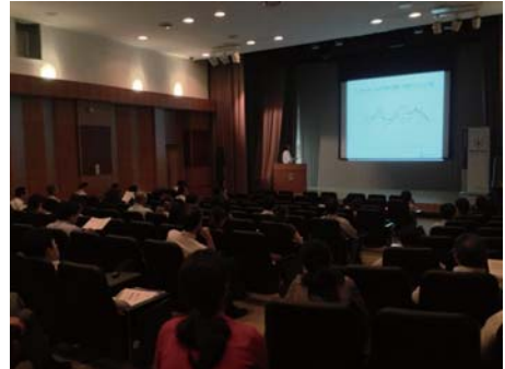
会場内の様子。たくさんの方が真剣に講演に耳を傾けています。毎年満席となります。