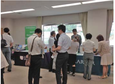
出版社展示ブースの様子。発表でできなかったことや、普段から相談したかったことなどお気軽にお話しいただけます。