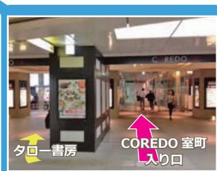
タロー書房が目印です

会場は「COREDO 室町」です。「COREDO 日本橋」とお間違のないようご注意ください。