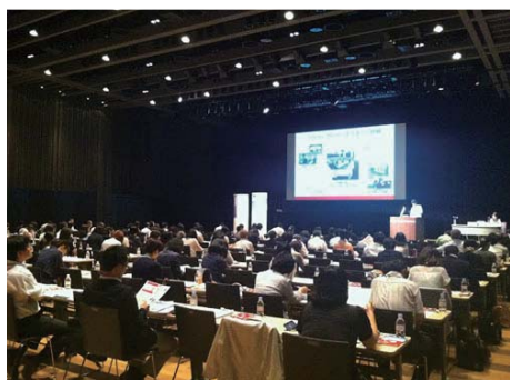
会場内の様子。たくさんの方が真剣に講演に耳を傾けています。毎年満席となります。