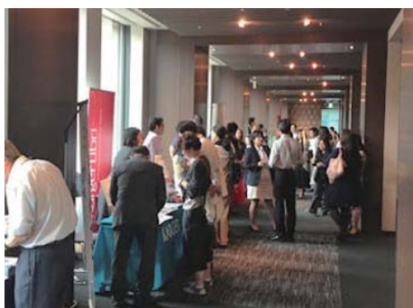
出版社展示ブースの様子。発表できなかったことや、普段から相談したかったことなどお気軽にお話しいただけます。